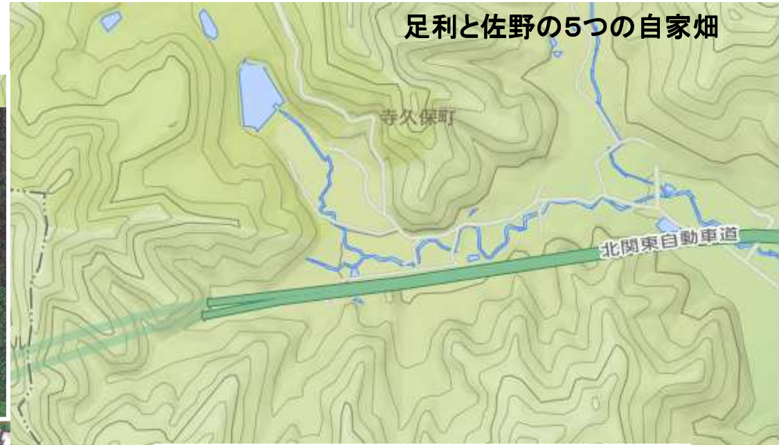
足利と佐野の5つの自家畑