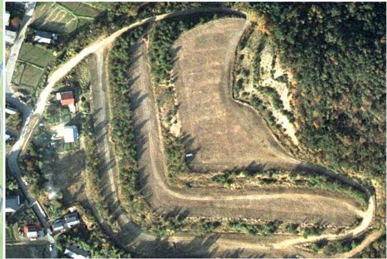
④テラス・ヴィンヤード(第1、第2)