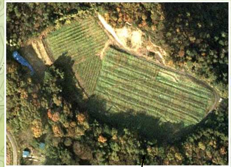
⑤赤見葡萄畑(佐野市)

○また海外では、1989年、こころみ学園の農夫たちがカリフォルニアに葡萄の苗木を植え、現在はこころみ学園の古い友人である醸造家、マット・クラインさんが良質のカリフォルニア・ワインを現地でつくっています。