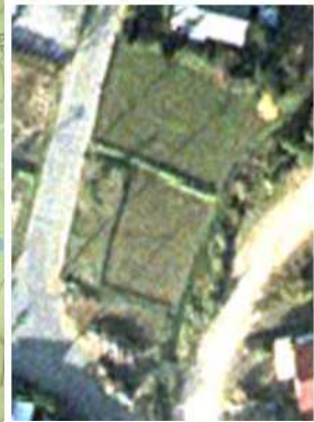
②フリセ・ヴィンヤード